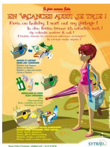
5. TRI / TOURISME