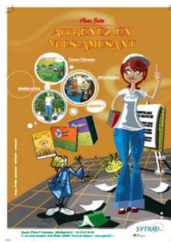
4. OUTILS PEDAGOGIQUES