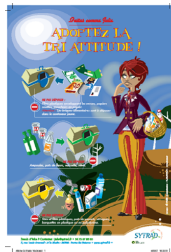
1. TRI / GRAND PUBLIC

Ainsi, si vous êtes intéressé pour recevoir les affiches ci-dessous, n'hésitez pas à télécharger le bon de commande situé aux rubriques [Animation & Pédagogie] et [Exposition] sur notre site Internet : www.sytrad.fr